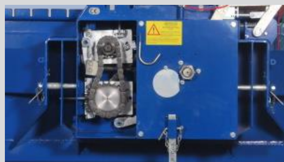
Abb. SW 500 U mit geöffneter Abdeckung. Das Untersetzungsgetriebe reduziert die Seileinzugsgeschwindigkeit.

Ausführung wie SW 500 jedoch mit Untersetzungsgetriebe