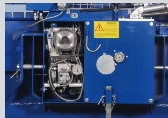
Abb. SW 550 UEH mit geöffneter Abdeckung. Elektroh ydraulische Steuerung für einfache Bedienung mittels Kabel fernbedienung. Das Untersetzungsgetriebe reduziert die Seileinzugsgeschwindigkeit.